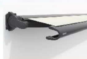
▶ Markilux 990