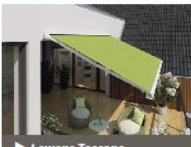
▶ Lewens Toscana