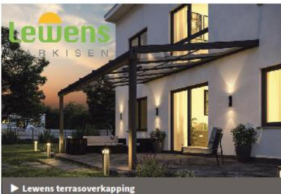
▶ Lewens terrasoverkapping