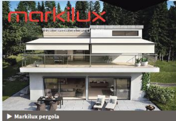
▶ Markilux pergola