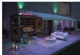
▶ Markilux MX_4 RGB