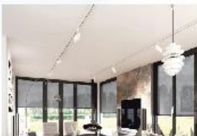
▶ Heroal ZipScreen