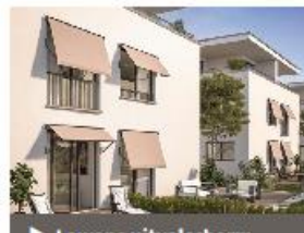
▶ Lewens uitvalscherm