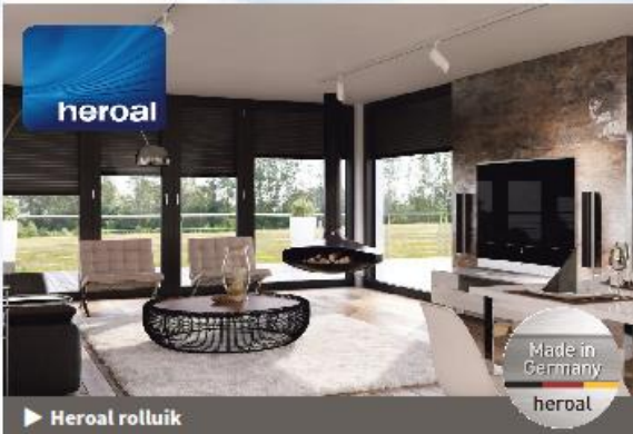
▶ Heroal rolluik