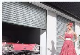
▶ Heroal rolpoort